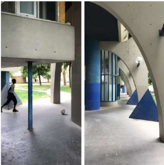
Cité Spinoza.

Tijdens een bezoek bij Cité Spinoza (1966-1973), een wooncomplex dat deel uitmaakt van het masterplan voor Ivry-sur-Seine, viel me op hoe de plint multifunctioneel gebruikt werd. De cirkelvormige betonnen openingen werden dankbaar ingezet als voetbaldoel door een groep jongens. Op de blokken om de hoek zaten senioren de spelende kinderen te bekijken en werden alle passanten gedag gewuifd. Het prachtige buitenentree fungeert als stedelijk interieur. De ruimtes die Gailhoustet schiep dicteren niet, maar bieden ruimte. 'Het plezier van wonen als een culture handeling', aldus de architect.