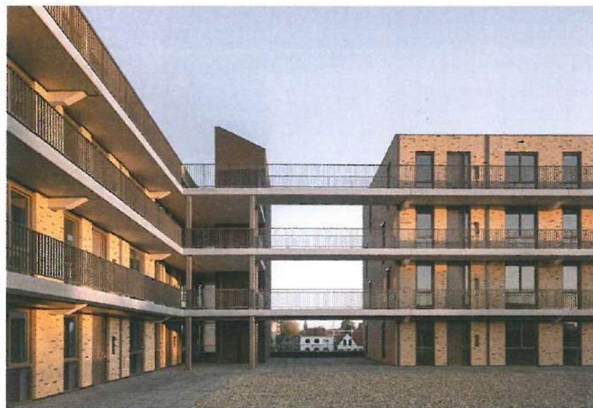
Een opening tussen de bouwdelen geeft een leuke doorkijk richting de binnenstad van Goes.