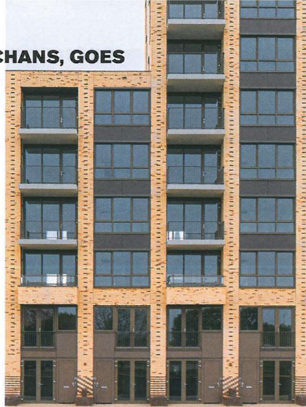
Kadewoningen hebben anders dan de bovengelegen appartementen, een halve beukmaat en een verdieping.