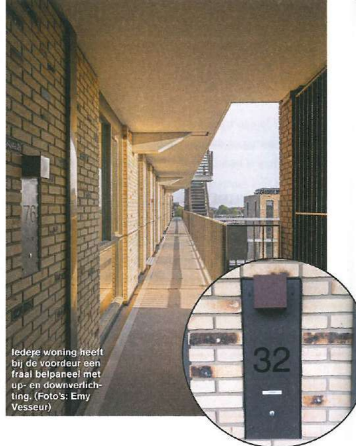
Iedere woning heeft bij de voordeur een fraai belpaneel met up- en downverlichting.

en maakt deze meteen herkenbaar als entree", legt Zoetmulder uit. "Voor de woningen op eerste verdieping vormen de torens tegelijk een oriëntatiepunt." De voordeuren van deze woningen liggen namelijk niet aan een galerij, maar aan het binnenterrein op het platte dak van de winkels eronder. Vanaf dit plein en de galerijen biedt een opening aan de zuidkant een leuke doorkijk richting de binnenstad.