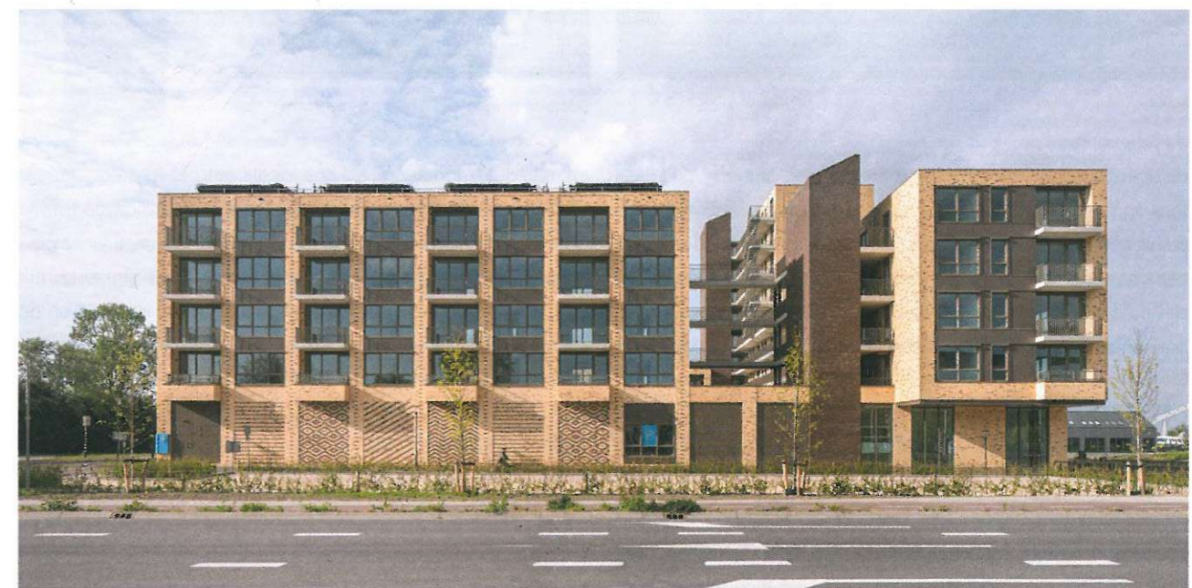
Stoffappatronen geven de gesloten gevels van de supermarkt een vrolijke touch. De horizontale lamellen in de deur van de technische ruimte zijn afgestemd op het patroon.

In de plinten van het gebouw bevinden zich de commerciële en technische ruimtes, behalve aan de autovrije kade. Daar zijn op de begane grond dertien kadewoningen gerealiseerd, die de activiteit langs het kanaal nog meer vergroten. Deze woningen hebben anders dan de rest, een halve beukmaat en een verdieping. Om de kadewoningen iets van privéruimte te geven op