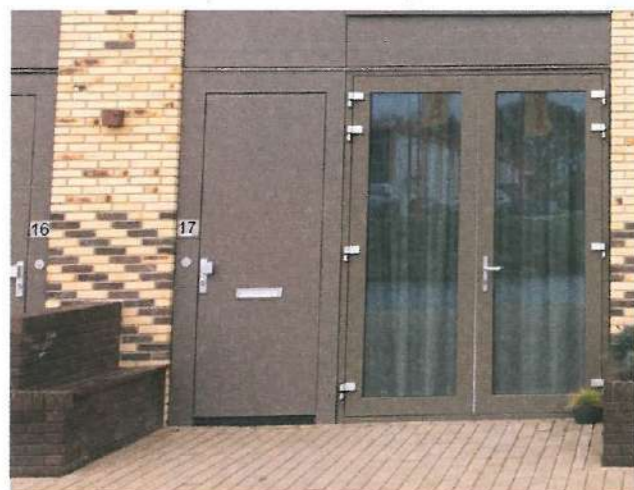
Geïntegreerde stenen zitbankjes en plantenbakken tussen de kadewoningen zorgen voor wat privacy op de openbaar toegankelijke kade.

Op de hoeken aan weerszijden van de kadewoningen is een open entreeportaal met veel glas en een brede trapopgang naar de lifttorens met trappenhuis. Deze lifttorens staan los van de hoofdvorm en zijn opgetrokken uit bruine baksteen. "De bruine kleur van de torens geeft extra kracht aan het zandgele gebouw