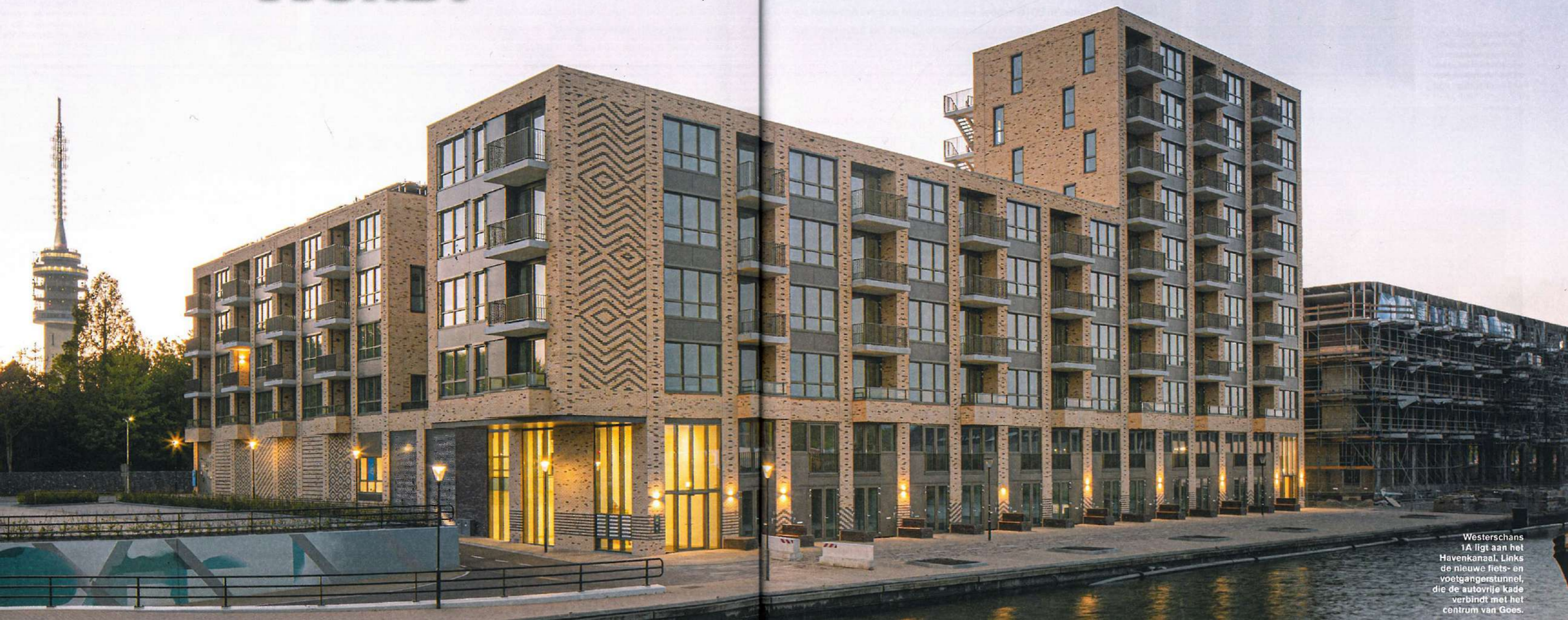
Westerschans 1A ligt aan het Havenkanaal. Links de nieuwe fiets- en voetgangerstunnel, die de autovrije kade verbindt met het centrum van Goes.

TEKST EMY VESSEUR